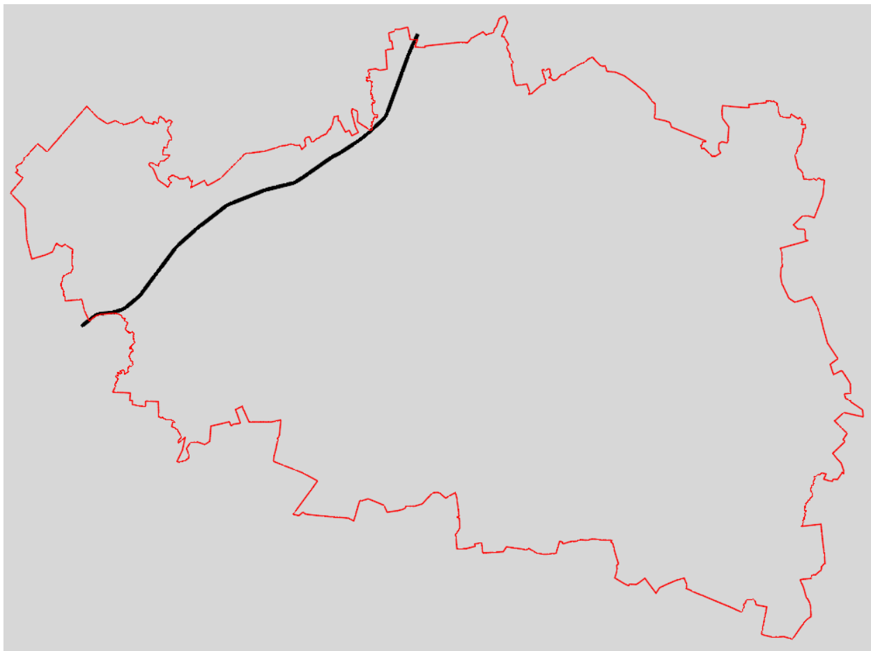
1 pav. Geležinkelio kelių tinklas Raseinių rajono savivaldybėje

Raseinių rajono savivaldybės teritorijoje esamos viešosios geležinkelių infrastruktūros kelių ilgis siekia 35,481 km. AB „LTG Infra“ patikėjimo teise valdo 1 viešųjų geležinkelio kelių objektą, jo duomenys pateikiami 1 priede.